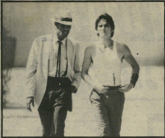
מט דילון: פירחה מתמחה

ספק אם הקהל הרחב, המשלם בכרטיס מלא עבור שעתיים קופולאיות, מוכן להתמסר לחקר האסתטיקה הקולנועית בלבד מבלי שתגוש לו המנה העיקרית, סיפור הגוף. דמויות של ממש, ועלילה בשרית. אבל קופולה מעדיף לעסוק בשעשועים צורניים: אחד מן הלב היתה הדגמת האולפן הקולנועי כתחליף לעולם הממשי, נערי הכרך השתעשע בתחקירי-צבע ומשחקי מילטריס ועתה עורך קופולה אורגנית-מצלמה עצבנית בשחור-לבן מסיביב לעלילה דמוית אידרתו הדקה של דג מלוח. אמנם יש כאן איזה סיפור קלוש על אהבת-יעורים, הטובעת