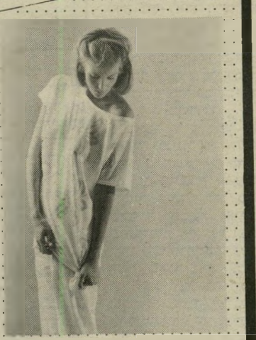
טריקו רומנטי באורך 8 (יכולה לשמש כשמלה)