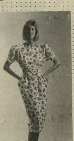
שמלת שנות ה-30 בד כותנה

רוגמניות: דורית ילינק