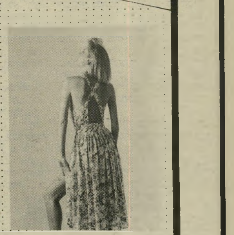
שמלה בד ויסקווה ברפוס עדין — גב בגיורת בגדיים