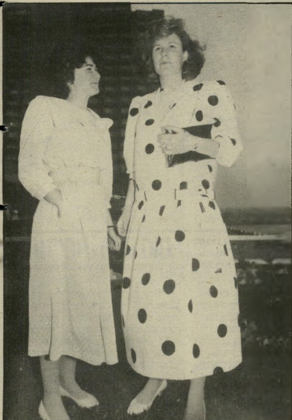
מתחת למותן השימלה מימין מנוקדת עם שר" ווליס עד אמצע המרפק. השמאלית: חגורה רחבה על המותן. צווארון מלחים ובד משי רך.