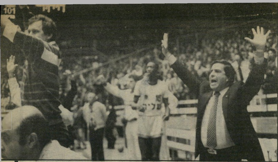
יו"ר מיזרחי (במישחק נגד ריאל מאדריד) לא נשחק בידים קשורות!

בשנה שעברה איימה מכבי תל-אביב לא להופיע למשחקי-הליגה. אם לא יותר לשתף שני זרים ובסופו של דבר הופעתם כאשר רק שחקן זר אחד ישחק בגביע אירופה. מדוע, אם כך, שיאמינו לאיומים הפעם? בשנה שעברה הכל היה שונה. אמנם איימנו, אבל אנשים מרכזיים מהפועל דיברו עם אנשים מרכזיים במכבי והוחלט שהפתרון יימצא עם תום הסיכוב הראשון, אבל לא יצא מכך שום דבר. היות והתחלנו את הליגה, לא רצינו לפגוע בקבוצות