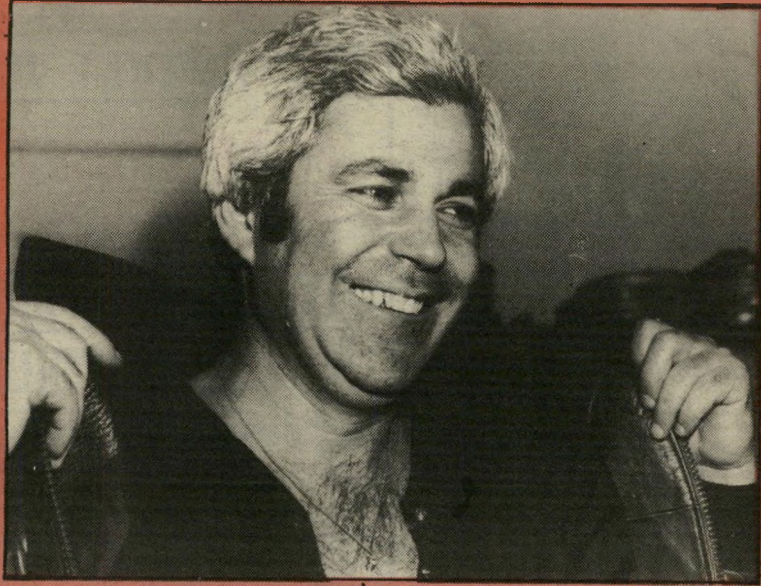
עוזר אלרואי מדוע לא ראו

הזמנת לוויין היא דבר יקר מאוד, כשעשר הדקות הראשונות שלו עולות 800-1000 דולר, וכל דקה נוספת 25-45 דולר.