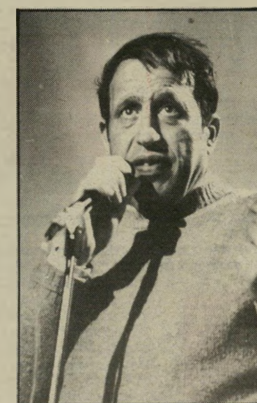
שומט חסון רק לא ישראל

פרס ורד הזהב, שהוענק לתוכנית התיז-מורת, בהפקת אולפני-הרצליה, היה במיסגרת תחרות מייגנית של חברות-הפקה פרטיות. אחרי הוכייה קרו לחנוך חסון, שופט בתח-רות מטעם הטלוויזיה הישראלית, שני מיקרים זהים עם שני נציגים שונים של תחנות-טלוויזיה ממזרח-אירופה. ככל פעם גרר אותו אחד מהם לפינה אפלה במיסדרו, שם הסביר לו שהטל-