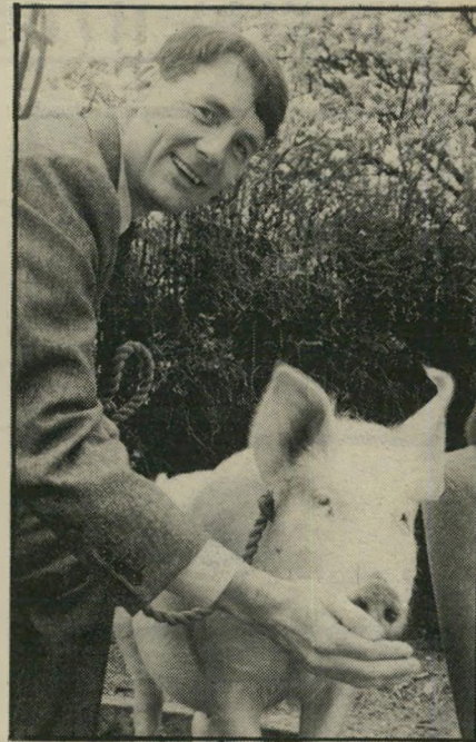
מייקל פאלין ב. טכס פרטי מוסר של חזיר