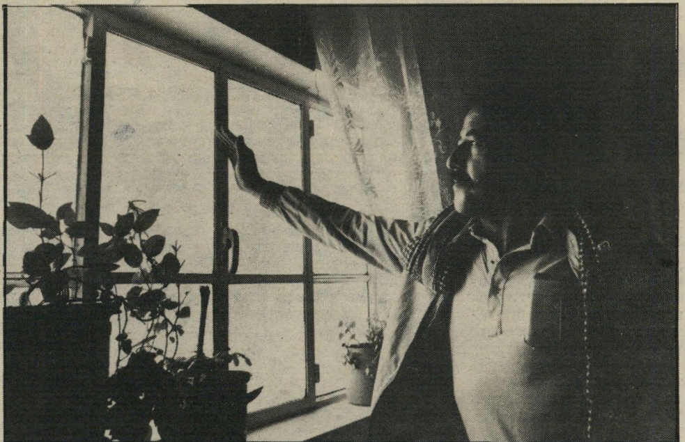
מיריות המתנחלים שעמדו למטה בחצר, וירו לעבר הבית במשך שעה ארוכה עד שהגיעו כוחות הביטחון. גם על קירות החדרים נראים נקבי כדורים רבים.

וכמה חלונות נשברו. פינינו את הבית מן הנשים ומן הילדים, כי חששנו שיש פצצה מתחת לבית.