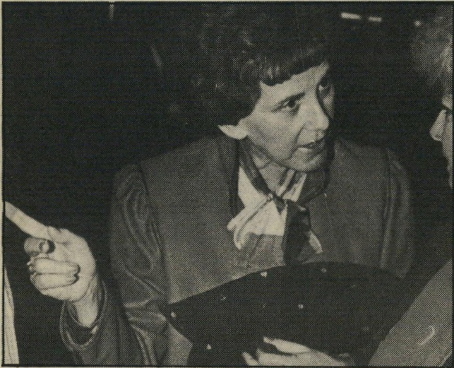
שופטת בן-עזית אין טעם למיסדר-זיהוי

הולנדית, בלונדית, רגלת שם מוזר כפטרונולה, איננה אורח גיל באולם המעצרים, ולכן נזכרה כתבת העולם הזה כי רק יום אחד קודם ראתה שם את אותה גברת יחד עם אחיה הצעיר. כן, אמרה נלי, אחי היה בארץ כי ייח, והוא נעצר. אתמול שיחררתי אותו בערכות והפקדתי את דרכוני