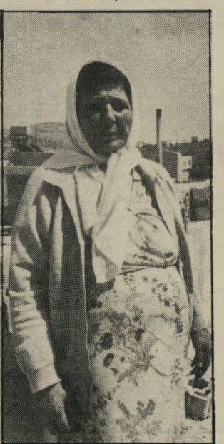
אמא על הגג דה המישפחה וניסתה להתגונן.

יודתי למטה חצר, לכרוק אם אין מיטען. אני יודע איך לנטרל חומר-נפץ. אז הגיעו השוטרים ואמרו לי שאין לי מה לדאוג. אין שם פצצה. אני לא מבין איך הם ידעו. הם אפילו לא חיפשו. הם הודיעו לי שהמתנחלים באו רק כדי לשים כרוזים על הקירות של הבית. איש מן השוטרים לא טרח לכבד ולברוק אם אין פצצה. אז גם ראינו את הכרוז עם התמונה שלי עליה, ושם היה כתוב שאני מבוקש בעוון רצח. המישפחה של טאלב ישבה לסעוד את סעודת הרמאראן והמתנחלים הגיעו שוב, חמושים. הם עמדו ליד הבית וצעקו במקרופון וכל מיני פצצות הארץ. שוב התחילו ריחות שנמשכו עד קריאת הבוקר של המואזין.