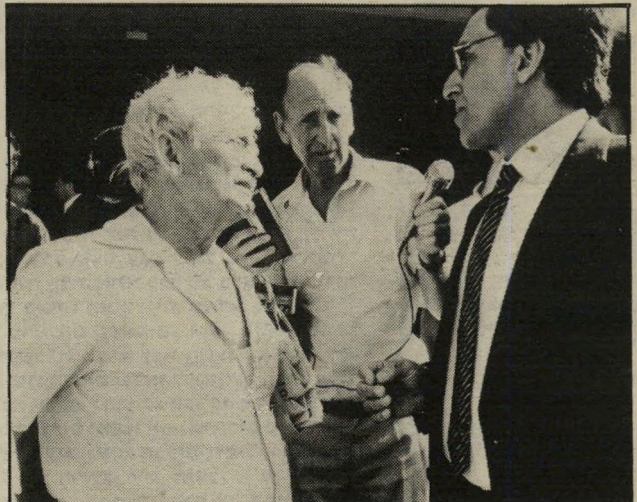
השר שחל עם גרוב - המפעל שקע למצולות

— איש מיקצוע מעולה, אלא בכך שהרשות דלה בכוחות-חקירה עצמאיים.