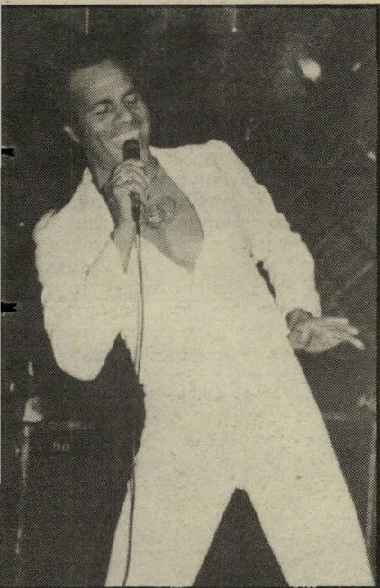
יוק קרדל בעלים ונשים

את הכישרונות לאנשים ונתן לו מכל טוב. גוף יפה, קול זהב, תנועות-זממות, חיוך משגע ומנה כפולה של גבריות. יכול להיות שמחשבות ישרונות באמת הגויים קצת. מי צריך את כל הדברים האלה בחדר?