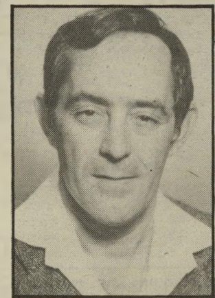
קצין־לשעבר מושיין לא קיבל רשיון