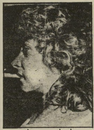
סמלת־לשעבר פולנסקי לא רצתה באשת השותף

לצוות הסמים הארצי היתה הצלחה מרובה. הוא הצליח לחסל כמה רשתות גדולות של מבריחי־סמים, ביניהן רשת שנקראה "הקשר התורכי". רשת אחרת שפעלה בהיקף גדול כונתה "הרשת הגרווינית". אנשי רשת זו נהגו להוציא מן הארץ עשרות קילוגרמים של חשיש, ולהבריח ארצה כתנאי על־כך.