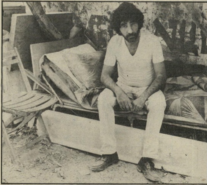
מיטה ליד הבסטו ליד הדוכן שלו בבני-ברק, שם הוא מוכר ירקות (למעלה). הוא רוצה להשתקם ומבקש רשיון לבסטו.