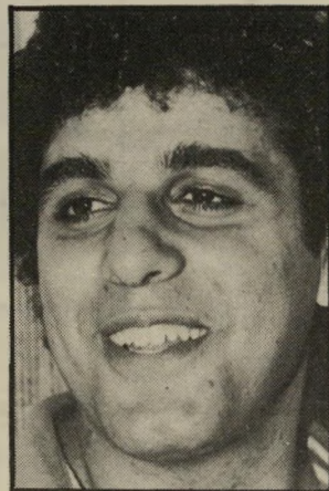
איש רעות פאנוס מכור לעניין

חברי רעות ביקשו מעוברים ושבים ברחוב דיוגוף בתל-אביב לחתום על הצהרת התנדבות לפלאנגות. מאת חתמו. ברעות נדהמו. ונותרו נדהמים