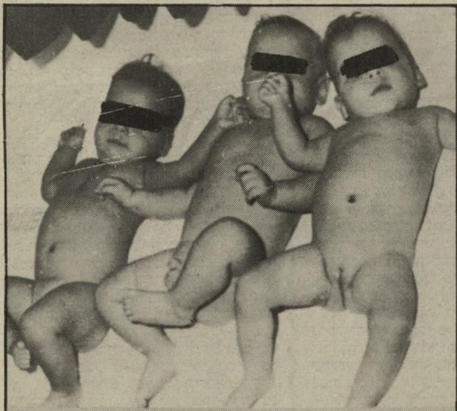
פגים מתפרעים בחדר-המינון

אם לא יזכו באלימות, ייצאו אוהדי בית"ר ירו" שלים לברדפורד להש" תלמות בשריפת איצ" טדיונים.