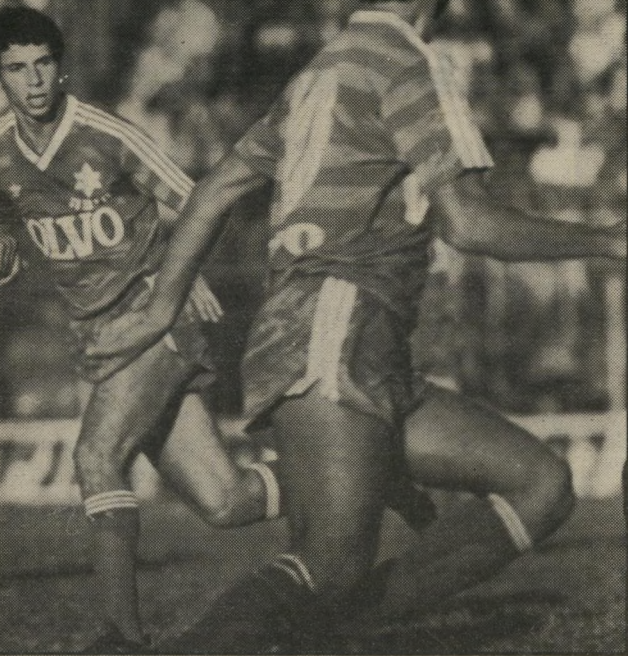
כדורגלן סלקטור (משמאל) במישחק נגד מכבי תל-אביב כשהוא מתרומם בתל-אביב. רואים אותו בניבעת-אולגה

סלקטור עצמו טוען שתואר האלי-פוט חשוב מכל, ואילו תואר מלך-השערים הוא רק תוספת לפרס העי' קרי. "רוב הסיכויים שזוכה באליפות, וזהו מיבצע יוצא מן הכלל, שקשה מאוד לשחזור ברציפות. תמיד אמרתי שאני מעדיף לזכות בתואר האליפות לפני מלכות השערים."