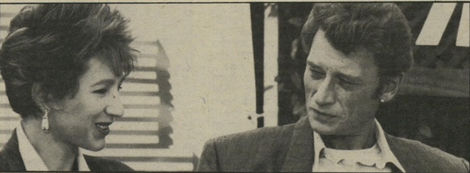
זמר העבר של הרוק הצרפתי, ג'והני האלידיי, עם בת-זוגו, השחקנית נאטאלי באי

באו גם דלפין סריג (נשיקות גנובות) ו ז'אקלין ביסה (הלילה האמריקאי); קתרין דנב ו ז'וראר דפארדייה (כוכבי המטרו האחרון בפאריס), שארל דנר (האיש שאהב נשים) וכוכבת אותו הסרט.