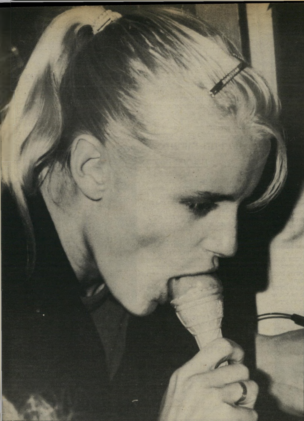
דריל האנה, כוכבת הסרט "סמלאש" מלקקת גלידה

איתן גרין ואסי דיין זכו למיספר צופים לא מבוטל. בהתחשב בהיצע העצום שיש לפסטיבל שכזה להציע לצופיו, ובעובדה שמחסום השפה העברית עדיין מקשה על צופים רבים, בנוסף על חוסר המידע ביחס לישראל, הניכר בכל מקום שבו מוצג סרט ישראלי כלשהו.