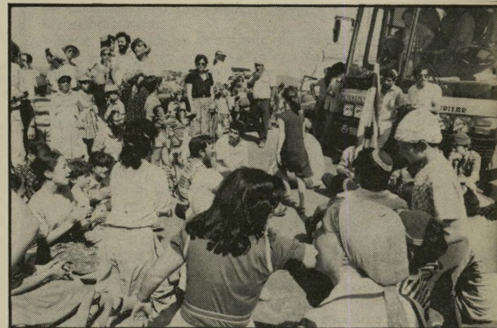
מחאה כמה עשרות מתנחלים מן הגדה המערבית חסמו ביום ה' שני בבוקר את כביש שכס'רמאללה. הציר שעליו היו האו' טובוסים עם האסירים אמורים לעבור וניסו לשבש את ביצוע ההסכם.

400 אסירים ביטחוניים ש' שוחררו במסגרת חילופי ה' שבויים נחרו לנסוע לחו"ל. בתמונה: על כבש המטוס.