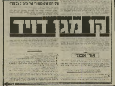
הכתבה בדצמבר 1966 השגריר הסובייטי צחק

של יאסר ערפאת. שהחל אז כוכש לעצמו במהירות מעמד חשוב בעולם הערבי. פעולה זו נתמכה על-ידי המישטר הסורי, שראה בכך אמצעי חשוב כדי ליטול את הכוכה בעולם הערבי מידי גמאל עבד-אל-נאצר. המנהיג המצרי שהיה אליל העולם הערבי. סוריה בישרה אז את הדוקטרינה של "מילחמת-שחרור עממית" נגד ישראל.