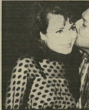
גילה גולן כמו בדאלאס

התסריט היה ידוע. זכיה בתחרות מלכת־היופי, נסיעה לחו"ל, חתונה עם מיליונר, נשיא חברת־הסרטים קולומביה, השתתפות בסרט האיש שלנו פלינט, שלוש בנות. מה שלא היה כתוב בתסריט המקורי היה שהיא תישאר אלמנה צעירה: אבל החיים זה לא סרטים, וזה בדיוק מה שקרה לגילה גולן.