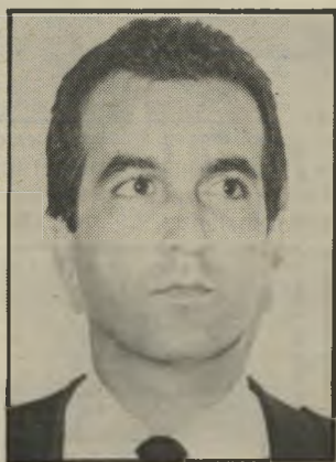
פרקליט כהן התגרות

השופט יחליט אם היתה זו קטטה של יום שישו או תקיפה ואיומים.