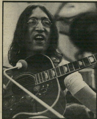
חיפושית לשעבר לנן מות אכזרי

הוא רונלד רגן, שהשמש במפת לידתו במזל דלי ואילו הירח במעלה ה-28 בשור. כאמור, במעלה זו מצוי כוכב שבת קשה ביותר, המראה על קשיחות, עקשנות, חוסר-יושר ונטיות אלימות באופיים של השניים. אם כבר מזכירים את המעלות האחרונות