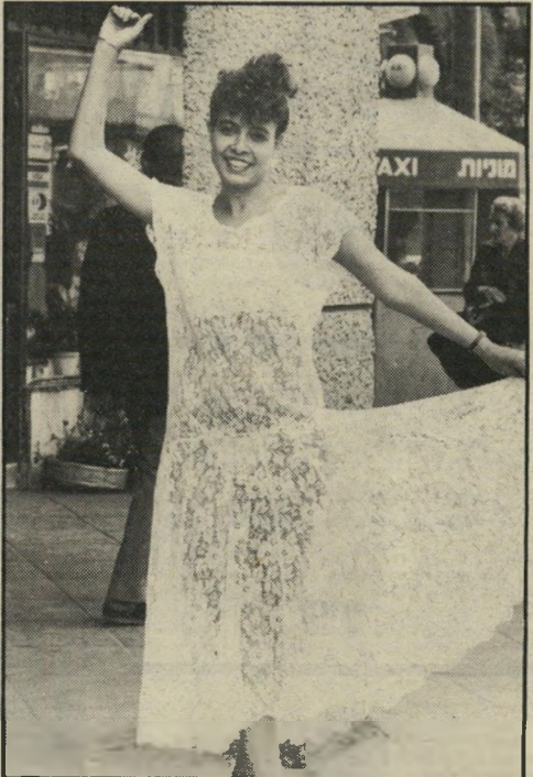
לסולידיות עיצבה מירה מחברת. מיץ, שימלה על טהרת התחרה. ללא ביטנה. מתחתה לובשים בגד-גוף בצבע הנוף או בגדיים קטן.