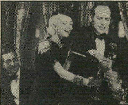
פרקינס וגולדבלום: סוכריה

נראה שגלישות מן הסוג הזה מתחילות לחיות חלק מן הסיננון של לאנדיס, וגם שיטת ההגשה של החומר אופיינית לו: המון אירוועים, הרודפים זה את זה, שיש בהם תמיד כמות מספקת שתספק את הצופה, גם אם מזמן לזמן מתחשק לו