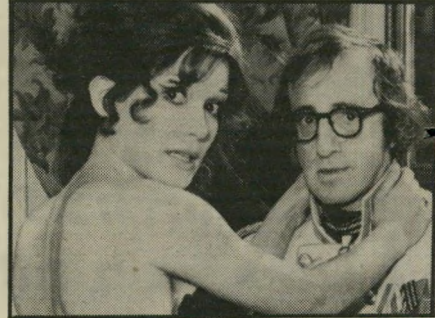
וודי אלן בפעולה מחוץ לתחרות

אין קמעט רגע שלא מתרחש בו פסטיבל-קולנוע כלשהו. טרם החל פסטיבל קאן, ביררוס צרפת, וכבר הסתיים פסטיבל קטן בעיירה קוויאק שבמערב-צרפת. המייחד את קוויאק, לכך מן הברנדי הנושא את שמה. הוא שה פסטיבל גדול מוקדש למותחנים בלבד. את הפרס הסרט למותחנים של ה. ל. סטודארט אוליברה, ופרס מיוחד של צוות השופטים הוענק לסרטו של ג'ון לאנגריס, רומן לילי (ראה שערן). ההיסטוריה לא באה. בקאן, נוסף ברגע האחרון לשמיטת האמריקאים שבתחרות פירט