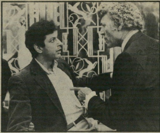
הוסקינס ולין: קשר מלאכותי

הבעיה האמיתית היא, שכל המריכבים הללו יחד לא נדבקים לשום דבר ברור, כל סיפור יכול להתקיים בפני עצמו והקשר שלו עם המריכבים האחרים בסרט הוא מלאכותי על-מסוף. אשר למספרים המוסיקליים, הם מרהיבים בפני עצמם, אבל יתכן שחיברו אותם יחד, היו יכולים לעשות מהם סרט מוסיקלי או תכנית בידור טלוויזיונית משובחת.