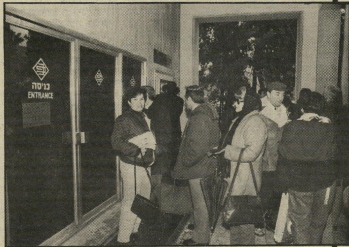
לקוחות בפתח הבנק שנשדד מי יודע מה הכילו הכספות?

כתבים הפליליים מדרווחים כמו עט מדי יום על פריצות וניסיונות פריצה לחררי כספות של בנקים. בעלי כספות רבים נוטשים את מגרי רות המישמורת בסניפי הבנקים. ההנהל לות הראשיות כבר דנות ברעיון לחייב כל לקוח לבטח את רכשו. יצרני כספות ביתיות מדרווחים על עליה משמעותית בהיקף הדרישה מצד אורחים. מרוב כהלה כמעט שנשכחה עובדת חיים אחת, והיא כישלון החקירה ה' מישטרתית של שור הכספות הגדול בסניף בנק הפועלים בירושלים. ייתכן מאוד שאי-הבאת השודדים