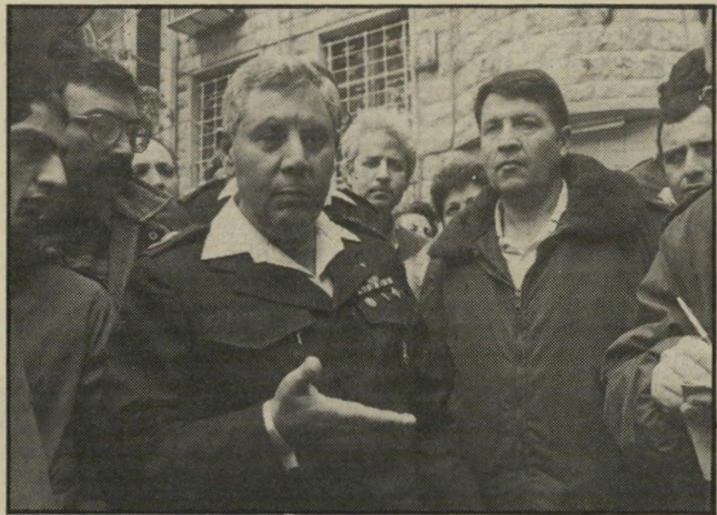
קצינים אלבלרס ותורגמן במקום השוד קינאת שוטרים גרמה מחל

לדין היא שמעניקה לאחרים את הארץ מץ להעז ולפרוץ כספות נוספות ברחבי כיה הארץ. לא מן הנמנע שיש אפילו יותר מקשר מיקרי בין האירועים.