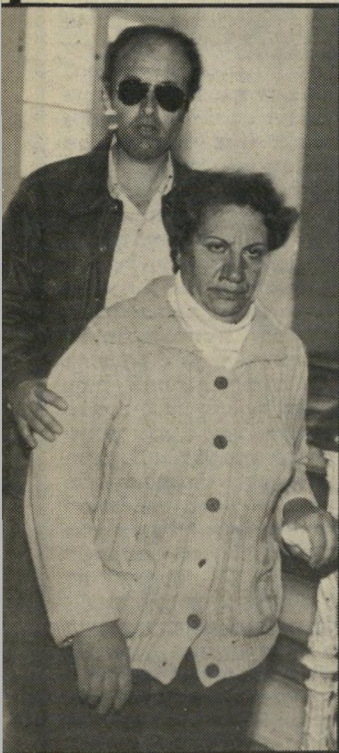
משוחרר מוזס - הרסת -