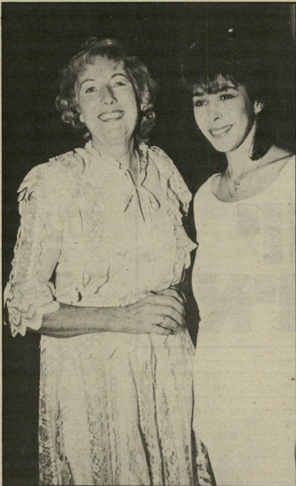
ורה לין הזמרת הבריטית, שהיתה פופולארית מאוד בתקופת מלחמת-העולם השניה וזכתה לפני שנים ב" תואר "דייס", היתה אורחת-הכבוד בכינוס העולמי של ארגון "וראייטי", שהתקיים — לראשונה בתולדותיו, בישראל — בשבוע שעבר. בקוקטייל הממאור, שהתקיים במלון "הילטון" בירושלים, הופיעה הזמרת גלי עטרי, שביצעה את השיר "הללויה" בחמש שמות. "אהבתי את שירתך", החמיאה לין לעטרי, כאשר הצטלמו יחד.

■ אצל הליברלים ליחשו השבוע: איזו בושה, איזו בושה... הסיבה שגרמה לגל המצ-פוני הזה היתה הזמנה שקיבלו ליברלים אחרים. ההזמנה היתה לערב (שנערך ביום הראשון) לכבודו של מנחם סבידור, יושב-ראש הכנסת הקודמת. את הערב אירגנו עיריית נס-ציונה ומועצת מוזכרת-בתיה. סבידור, שזכה בסטירות-לחי רבות מקרב חברי מפלגתו בחודשים האחרונים, זוכה, סוף-סוף, להחזיר למפלגתו סטירה משלו. ■ כשביקר שר-הכלכלה והד תיכנן גר יעקובי בשבוע