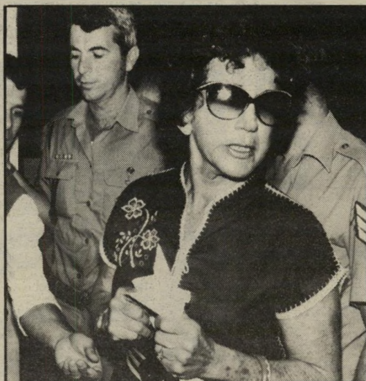
אביו ואמו של כניגל בבית-המישפט טלפונים באמצע הלילה!