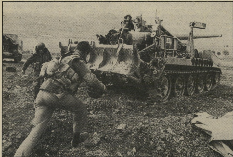
ישאר מאחור. החיילים אספו את כל הציוד מן השטח, ומה שלא נלקח נשרף במדורות של הלילה.