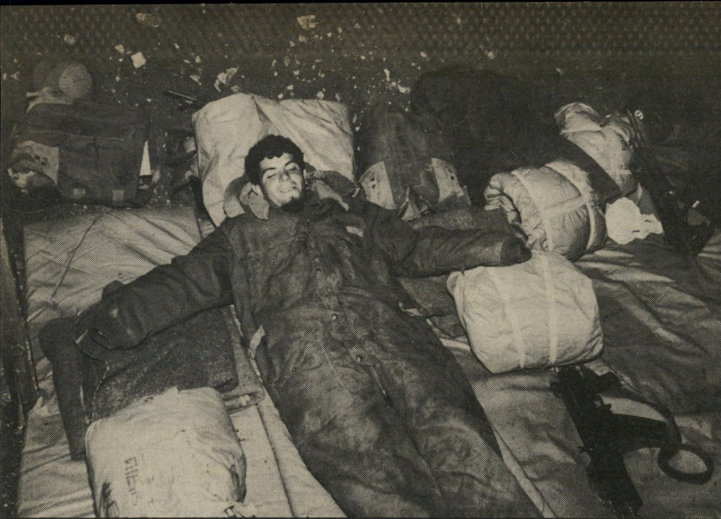
החיילים מתחת לסככה ענקית. אחרי שפירקו וארזו את האוהלים, בהם ישנו מאז פונו המיבנים. החיילים ישנו בשקי־שינה כשהנשק האישי צמוד אליהם.