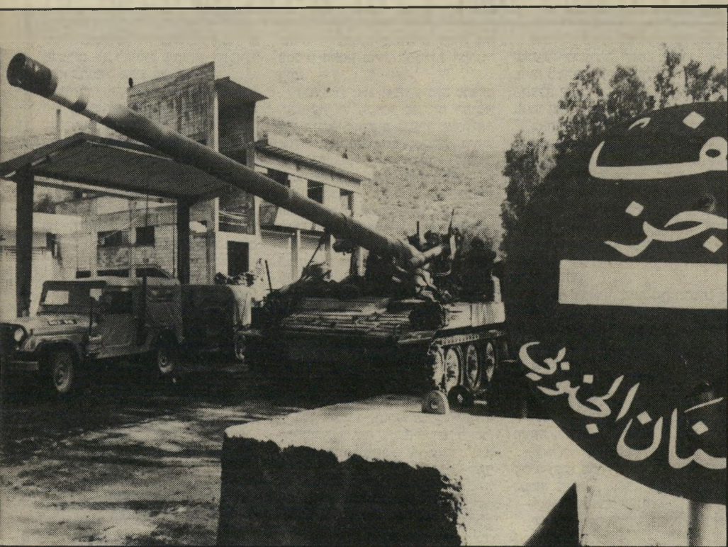
שלט, שעליו כתוב בערבית: "צבא דרום לבנון". ליד השלט יש מחסום של צד"ל, שחייליו צפו בשניות צה"ל הנסוגות דרומה.