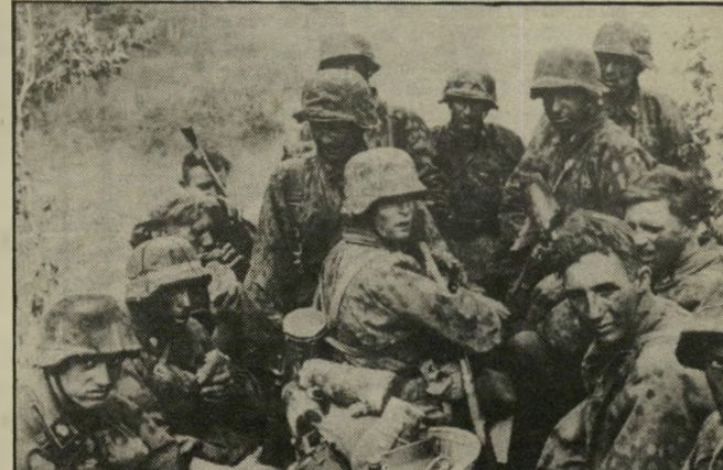
ס'ם החמושי בחזית הרוסית קנאים ללא מעצורים

רק כליהת-העמולה הסובייטיים יצאו נגדה, כצפוי, אלא גם דעת-הקהל הנאורה בעולם המערבי. ראשי ברי-טניה וצרפת התייצבו בגלוי או כמעט-בגלוי נגד בעל-בריתם, הנשיא האמרי-קאי. טובי הנוער הגרמני התייצבו גם