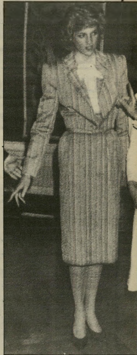
הנסיכה דיי באיטליה בין מובטלים לאיטלקים

העיתונאים הבריטים חזרו בהם מן הביקורת. הם דווקא שמחו שדיאנה הראתה סוף-סוף לאיטלקים מה זו אופנה אמיתית, וכתבו שהגיע הזמן שהאופנה האנגלית תחזור לכותרות.