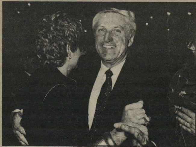
ראשיעיריה צייץ ואשתו הילדים היו ראשיעיריות

איתם, למרות שלא היה בקי במילות השיר. חבריו נדהמו מהופעתו. קטע שהוקלט לתוכנית. ושרליה גוטמן נאלצה לחתוך בין שני כריכה. היה הקפצות כדור כדור ואני כוכבי כדורגל, משה סיני ואבי בהן. גוטמן תיכננה שהשניים ימסרו ביניהם את הכדור, ושלכסוף יצעק צייץ תיקו. צייץ צעק מהר מרץ, מצב התרגשות. הקטע לא הצליח. נתחך החוצה. ביום השישי בבוקר, למחרת שידור התוכנית כשלווידה. נעצרה מכונת ליד ביתו של צייץ. ירד ממנה גבר קשיש, שבא במיוחד מכפריחוקאל. הוא הוציא מן הרכב דלי מלא פרחים טריים וציבעוניים. נתון אותו לראש עירייה וציבעוניים. נתון אותו לראש עירייה וציבעוניים. נתון אותו לראש עירייה וציבעוניים.