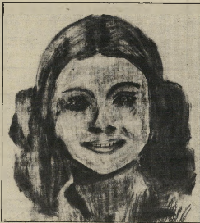
אפרת בציוור של פרי "היא קינאה!"

עומדת בצומת. הוא עצר ליד הרמזור שבו נעלמה הצעירה, אך לא ראה אותה. ואו המשיך לנסוע מוכה-הלם עד שהגיע למקום-עבודתו של אחיו. משם הוסגר למישטרה.