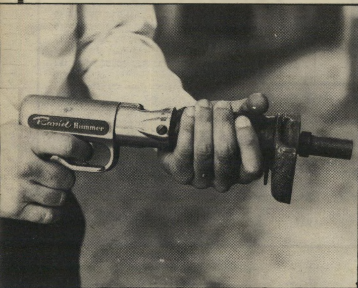
אקדחי-המסמרים סידור מיוחד לירי