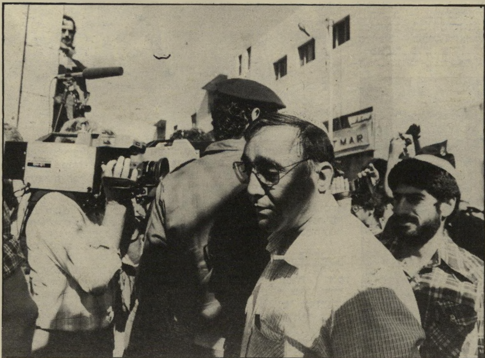
נאשם זר (באמצע) במישפט המחחרת פגיעה מוחית וחדר לא-מאוורר

כדי מישפטן מתחיל יודע כי רק במיקרים נדירים ביותר פוסל בית-