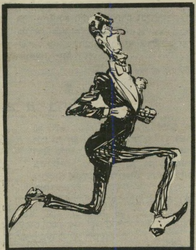
רגן לא השאירו רושם

מעמיק ורביעניין על בגרי תנועות הנוער — חולצה כחולה וצווארון לבן. מאשה ירוסלבסקי, תל-אביב