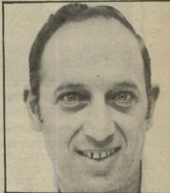
מנהל רשות ספורט אורן אין התלהבות

העובדה שאפילו קירקס מדראנו היה בסדר עדיפות שני עבור התלמידי הכדורסל מרצה לראות אקשיון בעירו מסבירה הכל. זה השבוע בו מדברים תלמידי רמת כדורסל. הדרכה התלמידי כפול שתיים, תחילת השבוע ובסופו, מרתק אלפי