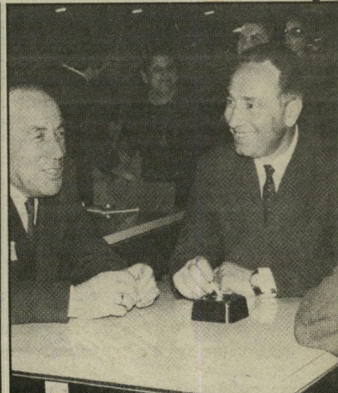
פרס ראש הממשלה שימעון פרס. בצעירותו עם שרגא נצר (משמאל). בתמונה מש-מאל: נצר עם דויד בניגוריון בתמונה אופיינית.