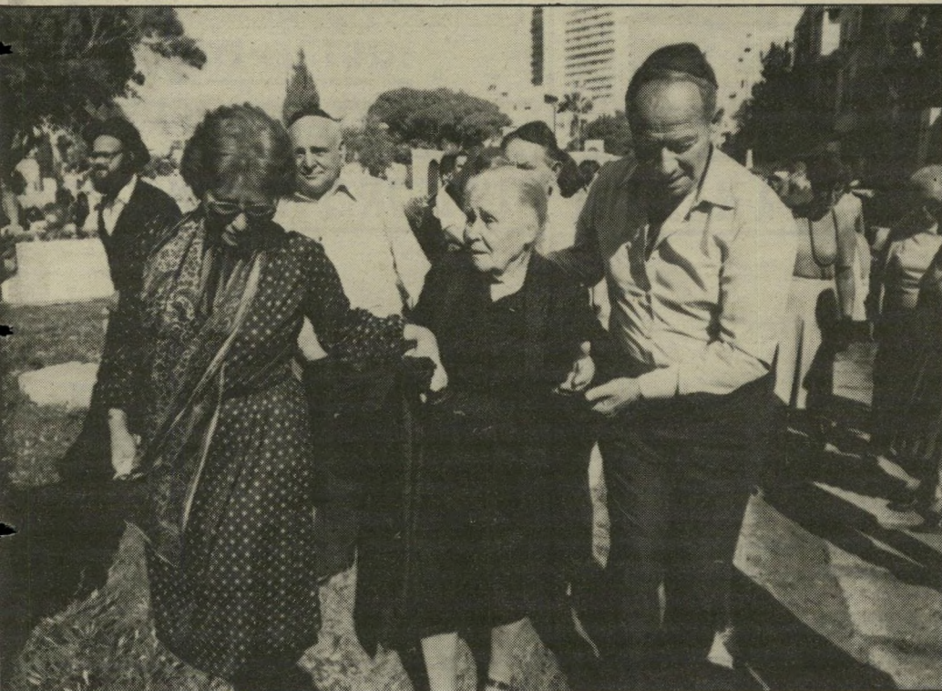
האלמנה דבורה נצר (באמצע). לשעבר חברת-כנסת של מפא"י וסגנית יו"ר הכנסת. מימין תומכת בה בתה, הפרופסור רינה שפי

רא. ומשמאל בנה משה. רבים מוותיקי המפלגה ניגשו בסיום טקס הקבורה אל האלמנה וחיבקו בחום. חלקם גם התחבקו האחד עם השני כשנפגשו. שאל: מי? אמרתי: משה דיין ויגאל אלון. לפי דעתי הם מייצגים בממשלה את הערבים. השיב לי בשאלה: אתה חושב שאקבל את הדעה הזאת? אמרתי: אל תקבל. כשראיתי שעדיין לא הבין את הרוח שבה נאמרו דברי החלטתי להמשיך את המישחק והוספתי: למה אתה רוגז על זה? ערבים הם יודעים? יודעים. את מינהגי הערבים יודעים? מכירים? אז מה חסר להם לייצג את הערבים? בגלל זה שהם יהודים? והוא עדיין לא היה בטוח אם אני מדבר ברצינות או מתלוצץ.