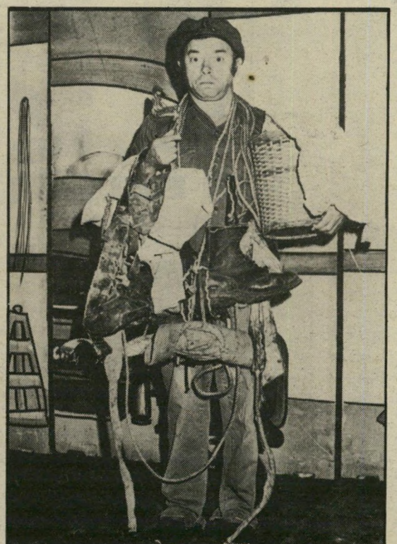
בודו ב. מוישה ונטילטור נכס צאן ברזל