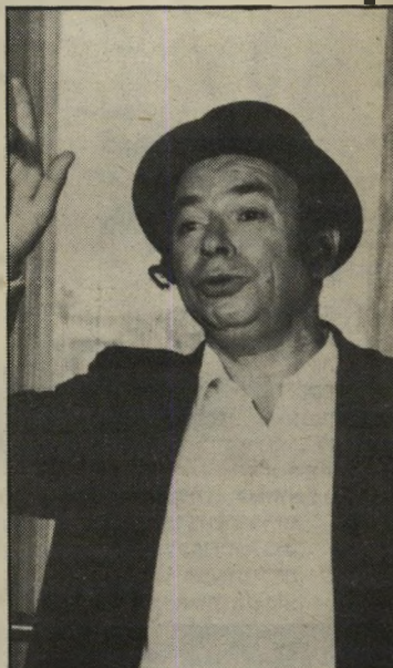
כשחקן יידיש. לופט געשעפטען?

לעיסוקו הנוכחי, הוא סבור, הבריא אה אותו יד הגורל. הוא מרגיש כמו חוזר בתשובה. אחרי הכל, היידיש