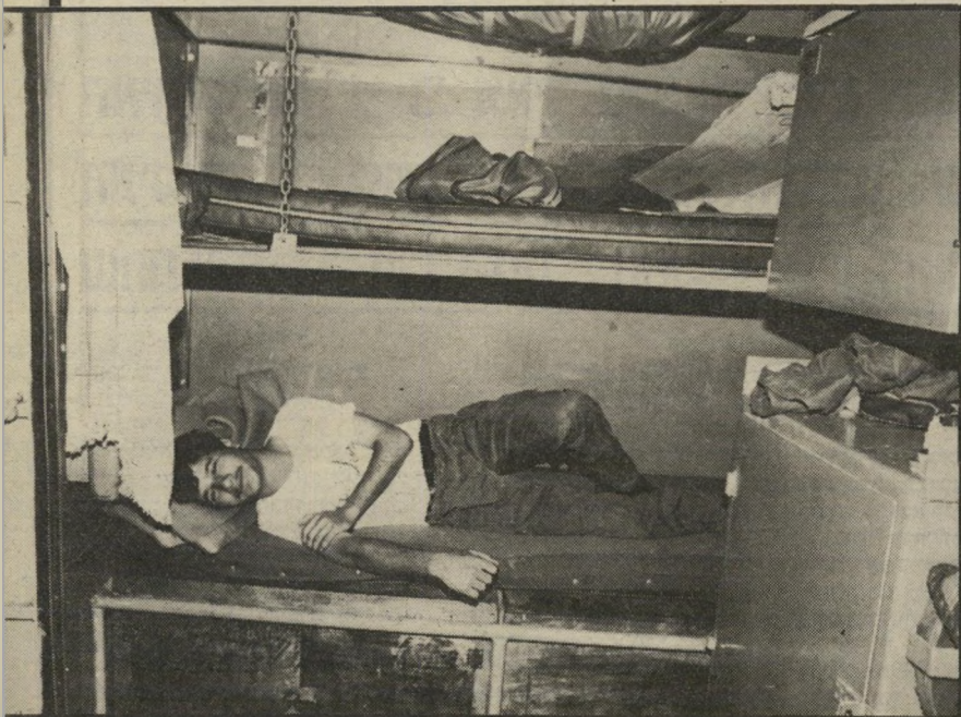
יאיר המפקד תפקידו הרישמי של מאיר - ימאי. הוא ישן בקבינה האחורית של הספינה. בקומה התחתונה של מיטה דו-קומתית. בדבור שתי קבינות כאלה. בכל אחת שתי מיטות. בשעות שאנשי הצוות אינם במשמרת, הם נחים במיטות.

קשידה למצוף בשעות שהדבור אינו מסייר לאורך החופים. והוא נקשר אל מצוף הנמצא אי-שם. אז יכולים אנשי