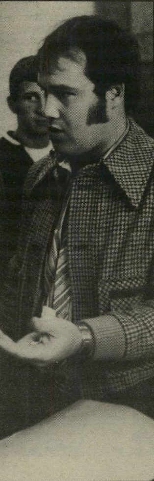
קצין רז כתב־שקר בהבל־פה

(המשך מעמוד 11) תוצאות גלאי־השקר קבילות. הרי שרדיחיד יכול להיעזר בהן. תורגמן עשה נסיונות אחרונים, נואשים, לשכנע את היועץ־המישטרי לשנות את החלטתו, אך לא הצליח. "מה יעשה תורגמן?" הפכה להיות השאלה הנשאלת ביותר. הוא ענה עליה במכתב־ההתפטרות שלו, כתחי לט אפריל. תורגמן, שהיה מפקד־מחוז ואיש מישטרה בכיר במשך שנים רבות, ואשר נהג כמאות מיקרים לבקשת מעצר חשודים על סמך תוצאות גלאי־השקר, החליט לתקוף במכתב־ההתפטרות את המכשיר שהכשיל אותו. "הפוליגראף רחוק מלהיות מכשיר המגלה את האמת והחושי את השקר רגים": הצהיר האיש, שפקודיו השתמ