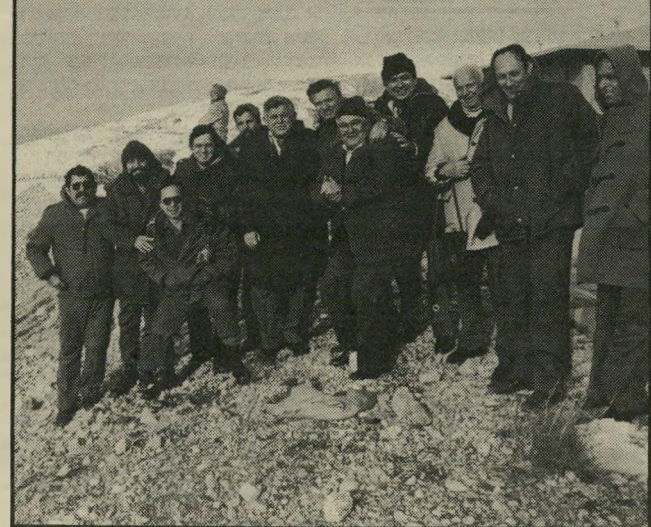
ועדת-החוקי-הביטחון בלבנון הבורות חוגגת

על כל פנים, כאשר הבינו ראשי המאורנים כי הסטאטוס-קו אינו יכול להימשך, הם החליטו להקים תרופה למכה ולהתנפל על יריביהם. לפני שאלה יתנפלו עליהם, אין ספק כי מילחמת-האזרחים הלבנונית הנוראה, שהחלה ב-1975, החלה ביוזמת ה מאורנים. בסמכם על העזרה היש-