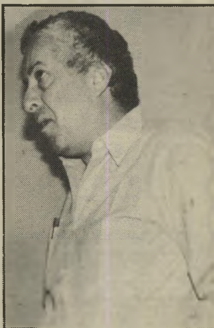
נאשם לביב כמעט כמו יוגל

עצום, סיכס מורחי. הוא עצמו לא התלונן במישרה, ואמר כי לא היה מעוניין להתלונן, מכיוון שקיבל את כספו בחזרה. כשבאו אליי מן המישרה עם הסיפור, לא התייחסתי אליו, כי זה היה שבע שנים אחרי, קיבלתי את כספי ולא היה לי עניין בזה, סיכס.