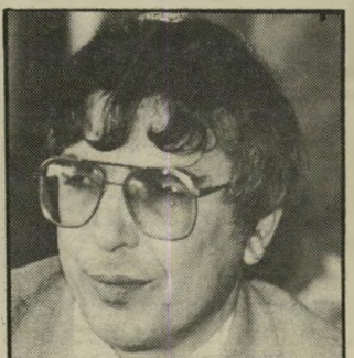
אבו חצירא עדיפות לפאריס

הסידור האידיאלי לכולם: גם לו וגם לסוככים אותו. קשה ליצור תיקשרות בסיסית עימו. כמעט תמיד חל איזה נתק; או שהוא נפגע מבלי שהתכוונו לפגוע בו, או שהוא פוגע מבלי להתכוון, נפגע וחוזר-הילילה. כל אלה יצרו לו שונאים מושבעים, המפיצים שמעות משמר עות שונות, המטילות דופי בכושרו לתפקד בדרגת אחריותו הנוכחית. זה תהליך שסגר את האיש עוד יותר. וחבל: בהודמנויות המעטות שבהן השתחרר ונפתח, אני חייבת להעיר, הוא אחד מבני-השיחה המעניינים והמגוונים ביותר בכנסת.