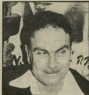
אמוראי אהבות מכל הלב