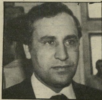
קצב חשיבות חדשה

לעולם לא תפגשו בו מסב בצוותא עם עמיתים לממשלה או לכנסת. שולחנו כמיזנון עמוס תמיד יועצים, דוכרים ועוזרים לרוב. גם אם נותר כיסא פנוי, אל דאגה — איש לא יצטרף לשולחן. לרביץ יצא שם של איש בודד וחשדן כרוני, ולכן זהו