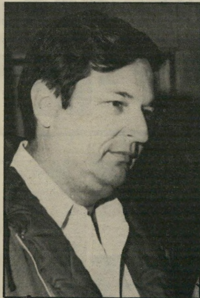
מנהל לביארי קרשקפיצה

או הסתבר שאירוע כזה יכול להיות משודר בתחנת גלי צה"ל רק אם יעבור דרך הטלפרינטר