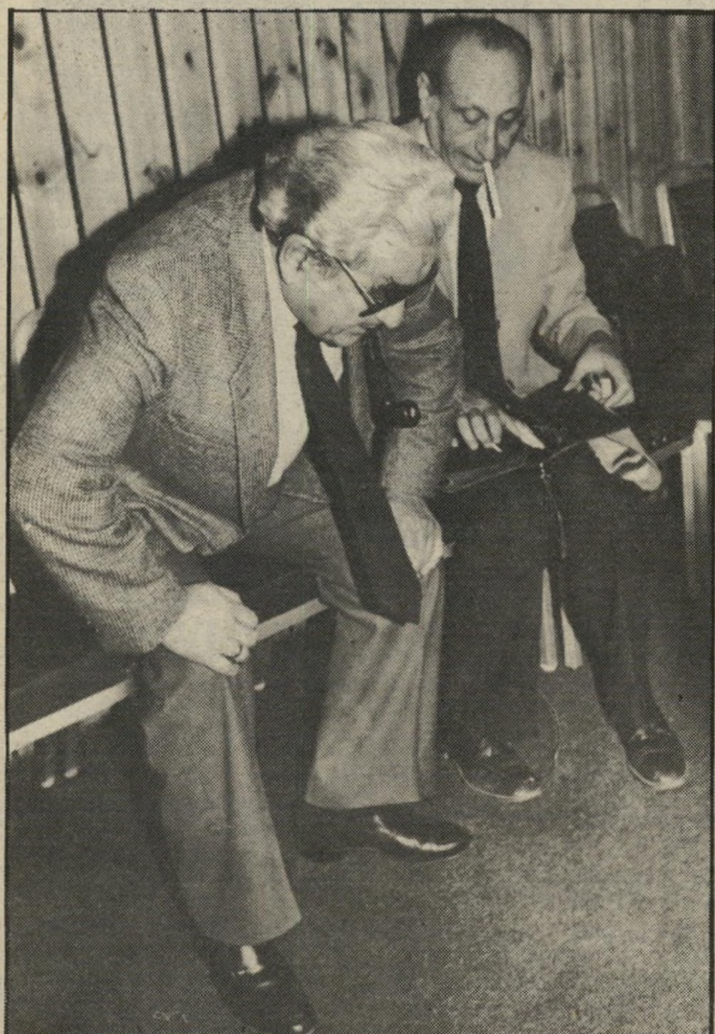
דולצין: ישיבה מקצועית

כעסו. פוליטיקאי ניכר בכיסאו. האם ניתן ם אלה על-פי הצורה שבה הם שואפים אל הרגע שבו יוצר גופו מגע עם הכיסא?