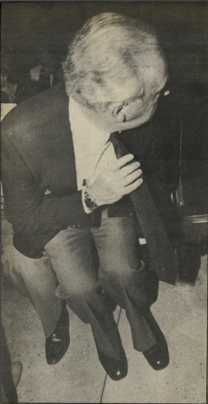
רבין: לתפוס את העניבה