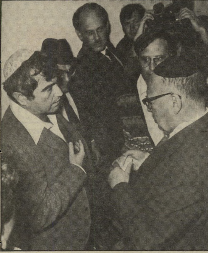
בורג והמר מידרשות ומחשבים, מיקוואות ועירובים