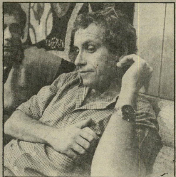
כתב צבאי שלונסקי ולפתע — יריות

יתכן שזו היתה הסיבה לתופעה שמאות אלפי צופי-טלוויזיה שמו לה לב באותו הערב: שלונסקי ישב במהדרות מבט מול חיים יבין כאילו כפאו שר, מתוח ומבולבל, וענה באירצון רב על השאלות.