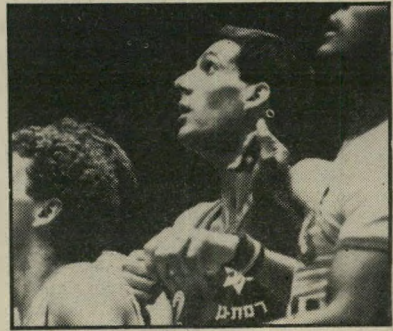
כדורסלן ג'מצי רמת-גן בגליל

נראה ששתי הפרשיות יהדהדו עוד חודשים רבים, ורק מישחקי הפליי-אוף, שנכנסו השבוע להילוך גבוה, עלולים להסיט את תשומת-הלב