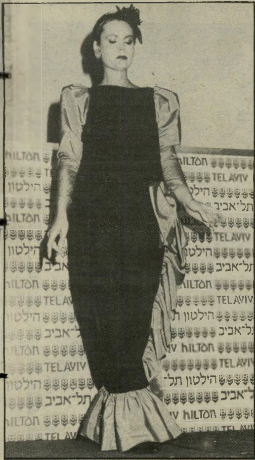
קטיפה חצאית ארוכה מקטיפה תואמת. משמאל: שימלת ערב מהודרת. בעיצובו של עודד פרוביזור. אופנת עילית מבד עילית - קטיפה שחורה. ואלניס מטאפט.