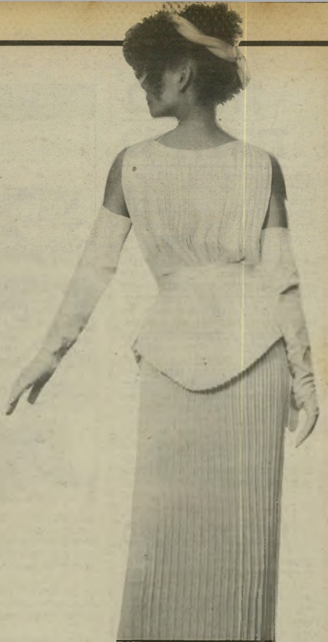
פליסה פאריסאי - בד החוזר לאופנה. המבליט חמוקים ומח-מיא לבעלות גוף חטוב. הדגם עשוי משי סינתטי. בגוון שמנת. הוא מזכיר את הסאטן. האורך - מתחת לברך. אך מעל לקרסול.