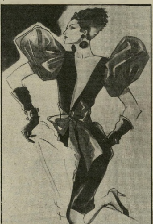
חושפני לבעלות חזה חגיגי: מחשוף נדיב, המסתיים במותן. הכל אקסטרווגנטי - השרוולים תפוחים, חגורת-בד במותניים וכפפות.