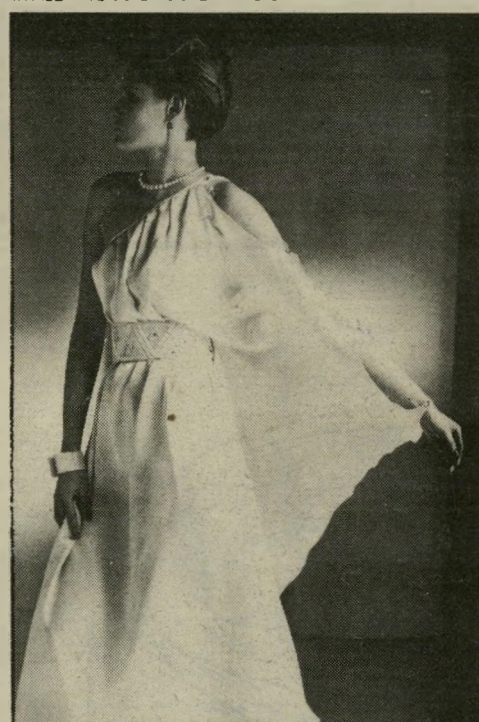
חושך כתף וגם זרוע: הבר ז'ורז'ט בהיר, הסיגנון אלכסוני. חלקה התחתון של השימלה - קלוש. חגורת פאיטים וחרוזים רחבה.

כחצאית הרחבה או בשימלה המסיימת מתחת לברך באיזה מקום. שימלה כזאת מתאימה במיוחד