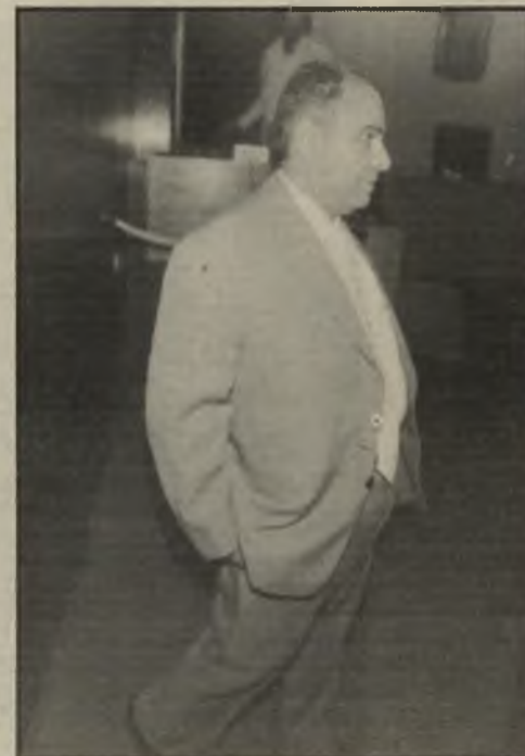
מתלונן שמש שמועות ורינונים

"חלקן של הכתבות היו קשורות למציאות וחלקן היו בגדר של שמר