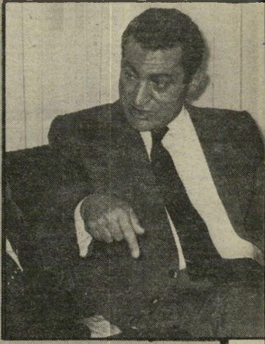
הנשיא מובארכ מיכשול בלתי-רעבתי

על רקע כישלון זה נראה כי גם שימנען פרס וגם יאסר ערפאת היו מפוכחים יותר מאשר מובארכ עצמו. פרס לא השיב בשלילה על היוזמה המצרית, מפני שסמך על הסירוב האמריקאי. תחת לעורר את הרושם שיוזמת-השלום הוכשלה על-ידי ישראל — כפי שהיה מורה אילו נוחלה המדיניות עליידי יצחק שמיר