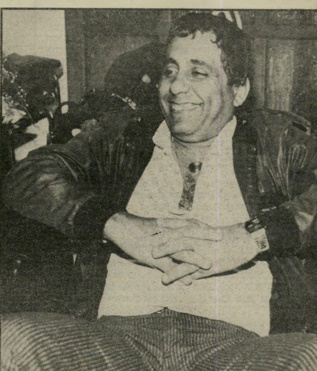
אמרגן ראובני בגלל הרוורס, הרימון לא הרג אותנו"